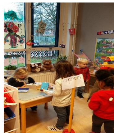
Werk aan de winkel!